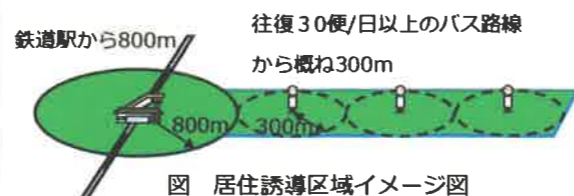
図 居住誘導区域イメージ図

※地形・地物や道路利用の状況等を踏まえ設定 ※ただし、居住誘導区域の設定が適切ではない区域は除く